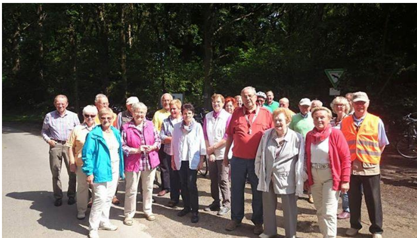
Radtour zum Sommerfest