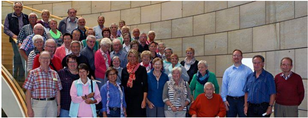
Kolping Greven im Landtag