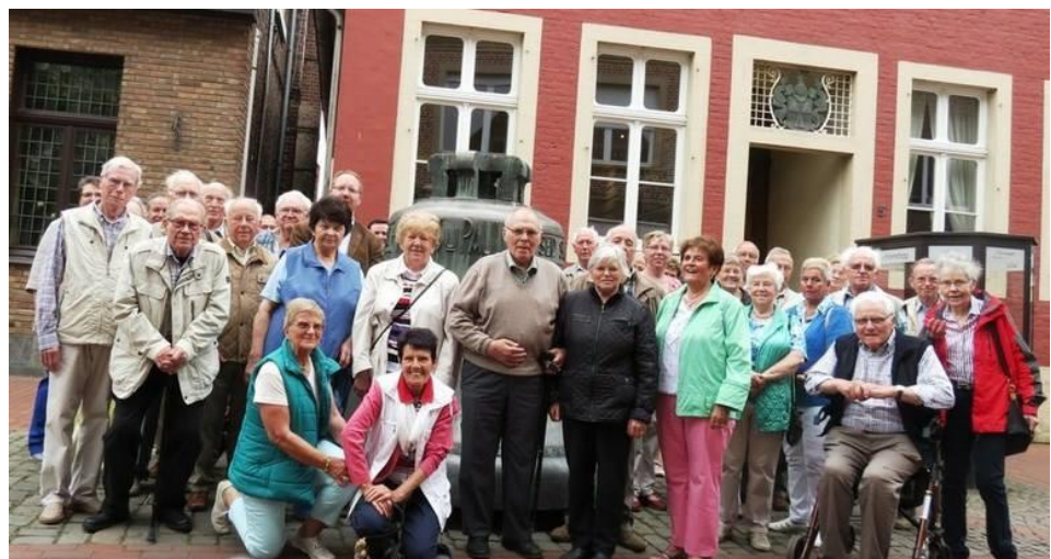
Tagesfahrt nach Gescher